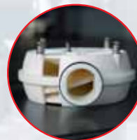
Nutating disk system