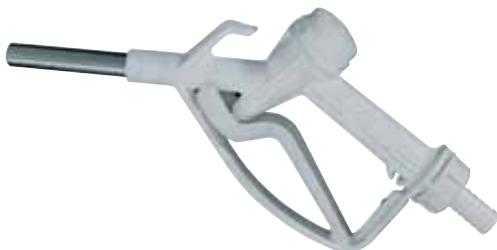
Manual nozzle available Code: F14761000