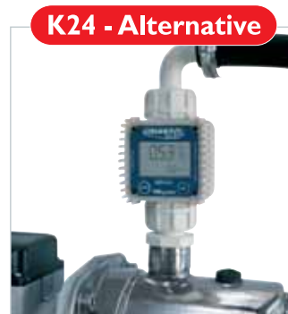
K24 - Alternative