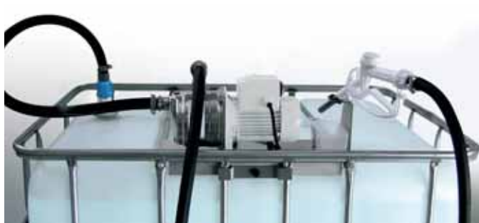
Suzzara Blue IBC without meter - Horizontal version