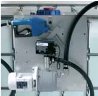
Suzzara Blue IBC with meter Vertical version