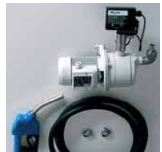
Suzzara Blue ST version